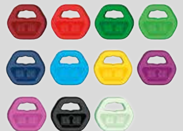
Färbige Schlüsselclips (Miniclips ebenfalls erhältlich)