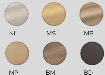
Zylinderoberflächen (nicht farbverbindlich)

Weitergehende Details und Bestellungen finden Sie im aktuellen Kaba Katalog.