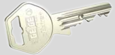
pextra+ Schlüssel mit serienmäßigen seitlichen Verriegelungselementen

Der neue Abfragestift dient als zusätzliches, blockierendes Element im Zylinderkern und blockiert bei manipulierten Schlüsseln den Sperrversuch in beide Richtungen. Bei Zylindertypen, die eine 360° Drehung des Zylinderkerns zulassen würden (z.B. Doppelzylinder), wird dabei das Sperren mit einem manipulierten Schlüssel verhindert. Diese nicht als mechanischer Einbruchschutz anzusehende Sicherheitsmaßnahme bietet somit einen hervorragenden Schlüsselkopierschutz .