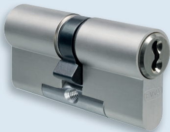
3K plus -Doppelzylinder