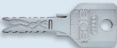
3K plus -Schlüssel